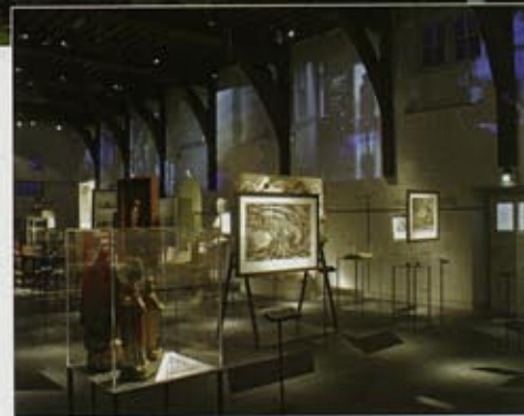
1 - Hoe de buitenwereld met stigmatiserende clichés aankijkt tegen gekte en waanzin. 2 - Middeleeuwse zorgzaal met overzicht van therapieën, medicaties, publicaties en filmfragmenten.