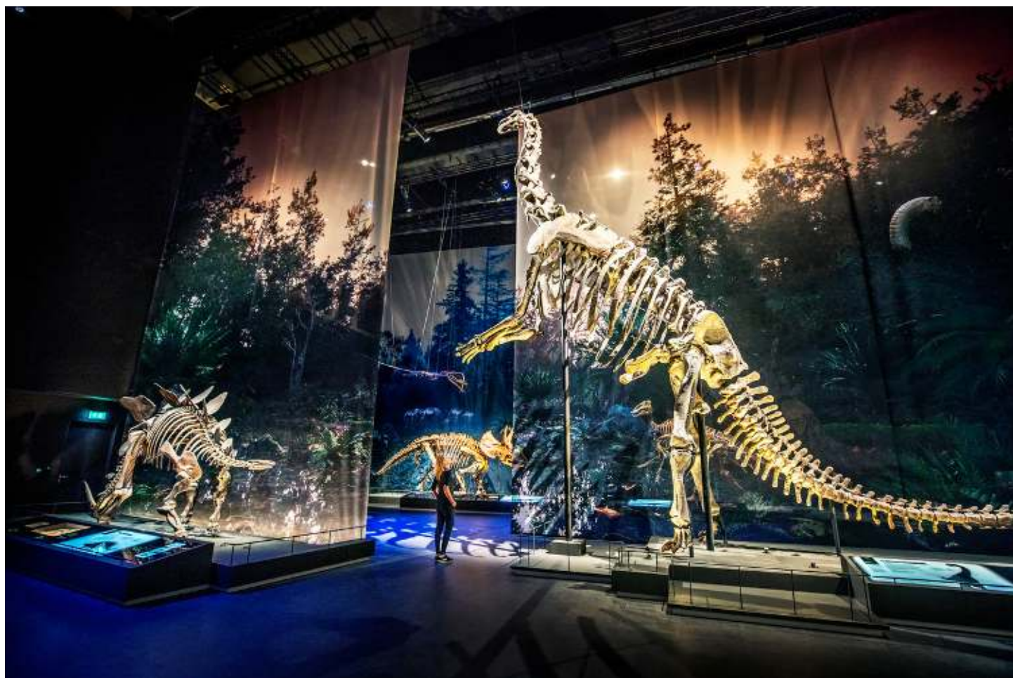
In de dinosauruszaal staan de skeletten van de oerkolossen uitgelicht tegen een decor van half doorzichtige doeken, waarop bewegende dino's snuivend en boerend rondscharrelen.

Eindelijk heeft Nederland een natuurhistorisch museum dat zich kan meten met de grote natuurmusea van deze wereld. Het nieuwe Naturalis, vanaf zaterdag open voor het publiek, blijkt een tot in perfectie verzorgde ode aan het leven op aarde.