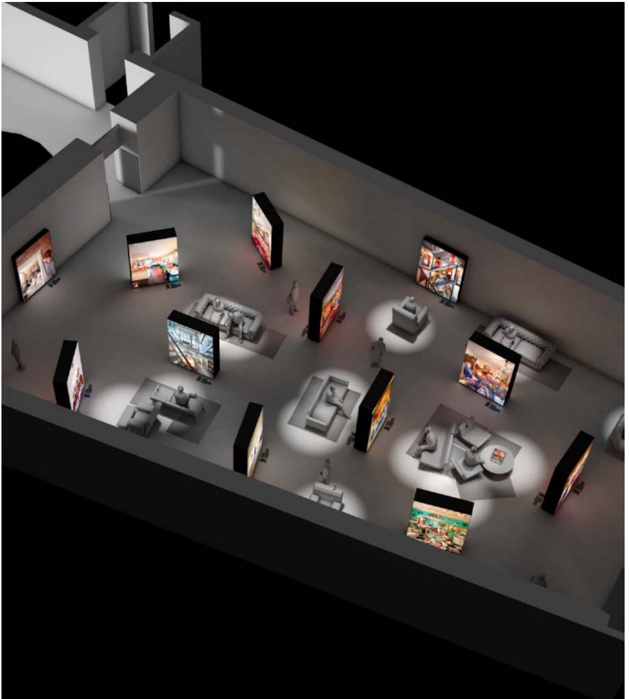
Opstelling tentoonstelling 'Binnenkijken met Thijs Wolzak'