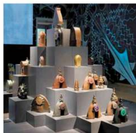
De tentoonstelling opent met een toren van bijzondere klokken. Bovendien prijkt de klok 'op schaatsjes' van De Klerk.