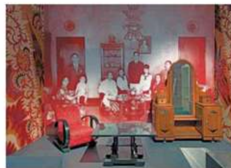
De Indische cultuur inspireerde ook de Amsterdamse Scholers.

Kramer ontworpen luxe warenhuis geldt als een hoogtepunt van de stroming. Maar het wordt ook wel haar zwanenzang genoemd. Want niet lang daarna zou de strakke vormgeving van De Stijl en het Functionalisme de architectuur in Nederland gaan domineren. In de huidige tentoonstelling is een kleine zaal geheel gewijd aan het bijzondere winkeliinterieur.