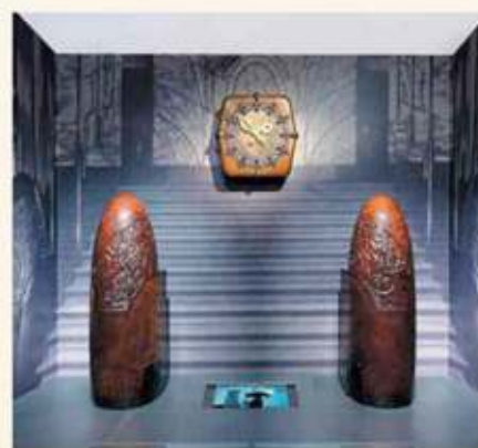
De klok en de rijkversierde houten trapbeëindigingen van de Haagse Bijenkorf.